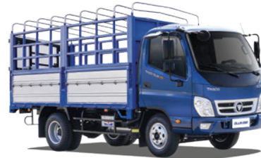
Thùng mui bạt