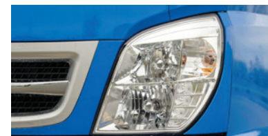
Đèn pha Halogen cường độ sáng lớn, thiết kế thẩm mỹ, tích hợp đèn LED hiện đại.