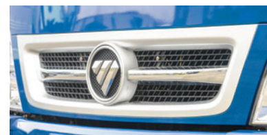
Mặt ca lăng mạ Crom sang trọng.