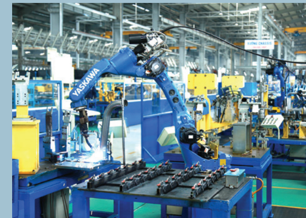
Dây chuyền sản xuất ống xả tự động bằng robot