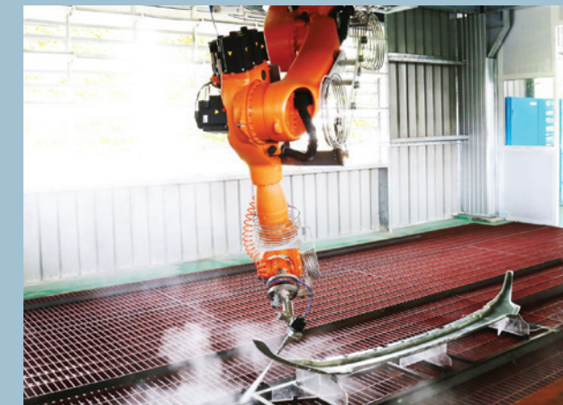
Robot cắt bằng tia nước