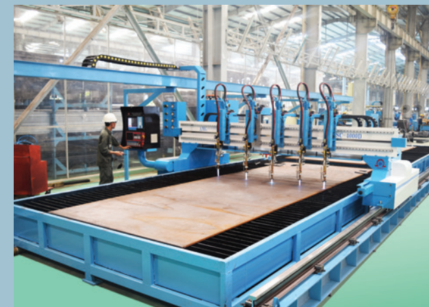
Công nghệ cắt Plasma