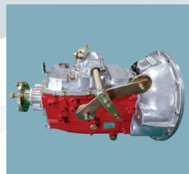
Hộp số có đổi trọng giúp vào số nhẹ nhàng.