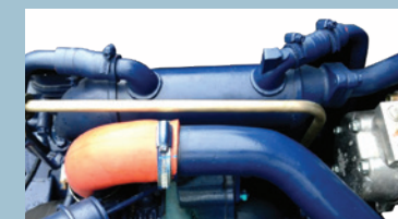
Hệ thống hồi lưu khí xả EGR (Exhaust Gas Recirculation):