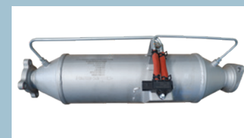
Bộ xúc tác khí thải (DOC + POC)