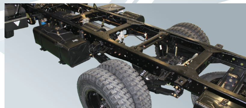
Chassis được chế tạo từ thép hợp kim chất lượng cao, sơn nhúng tĩnh điện, kết cấu vững chắc, khả năng chịu tải tốt.