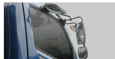
Cụm gương chiếu hậu gồm: 2 gương chính phẳng và 4 gương cầu giúp tăng tầm quan sát.