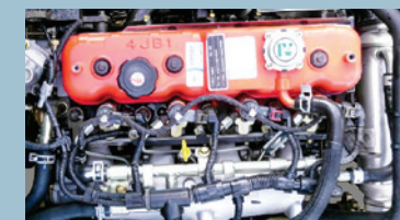
Hệ thống phun nhiên liệu điện tử (Common Rail + ECU)

THACO OLLIN 500 /700 /720 được trang bị động cơ Weichai, với ưu điểm mạnh mẽ, bền bỉ, tiết kiệm nhiên liệu.